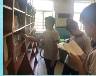
Yenilenen kütüphanemizde çalışma ve araştırma yapma imkanı