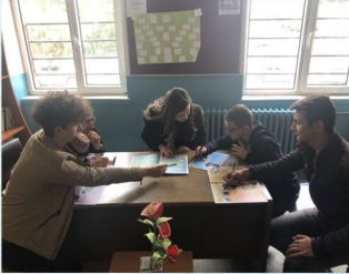
Okul Gazetesi Ekibimiz