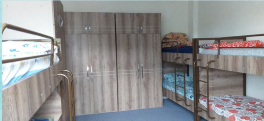
Yenilenen Pansiyon Odalarımız