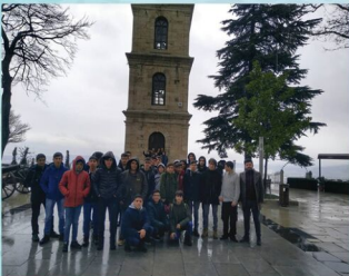
Gezi Planlama Kulübü