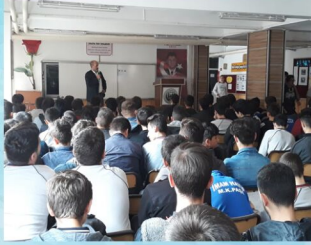
Çok Amaçlı Salonumuz