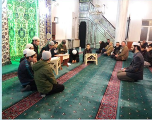
Uygulamalı Meslek Dersleri Eğitimi