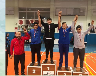
Okulumuzda futbol, basketbol, voleybol, güreş, masa tenisi gibi çeşitli spor alanlarında okul takımlarımız bulunmaktadır.